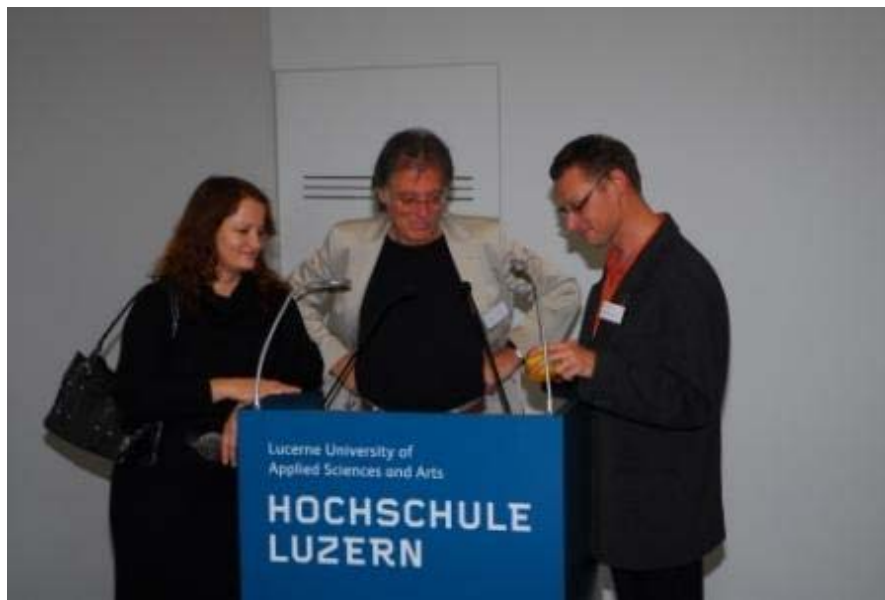
Congrès éducation sexuelle, nov. 2008

Bulletin d'informations du Centre de compétences pour l'éducation sexuelle à l'école Nr. 3 - janvier 2009