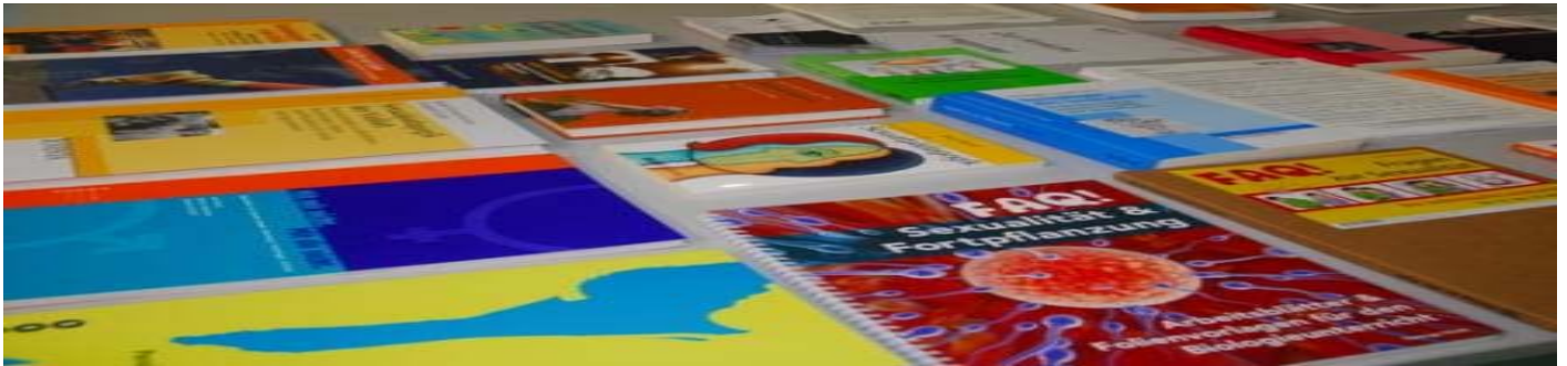
Congrès éducation sexuelle, nov. 2008

Hé les gars! (2008). Brochure d'information retravaillée, destinée aux adolescents. Elle peut être commandée à l'adresse suivante: http://www.aids.ch/shop/produkte/infomaterial/jugendliche/1054-02.php?lang=f