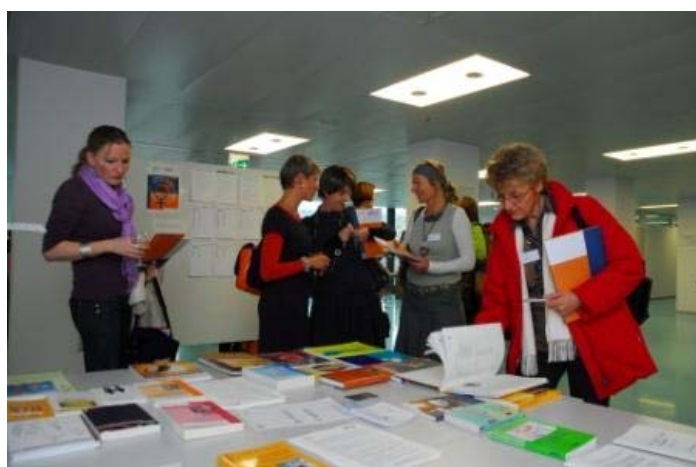
Congrès éducation sexuelle, nov. 2008

ARTANES, l'Association romande et tessinoise des éducatrices/teurs, formatrices/teurs en santé sexuelle et reproductive a fait part de sa position relative au Plan d'Etude Romand (PER) mis en consultation durant l'automne. Elle y a défendu l'intégration systématique de l'éducation sexuelle dans les programmes scolaires et la reconnaissance de l'exigence de qualité assurée par les professionnel-le-s. La position de l'ARTANES a été soutenue par PLANES, ainsi que par le Centre de compétences pour l'éducation sexuelle à l'école.