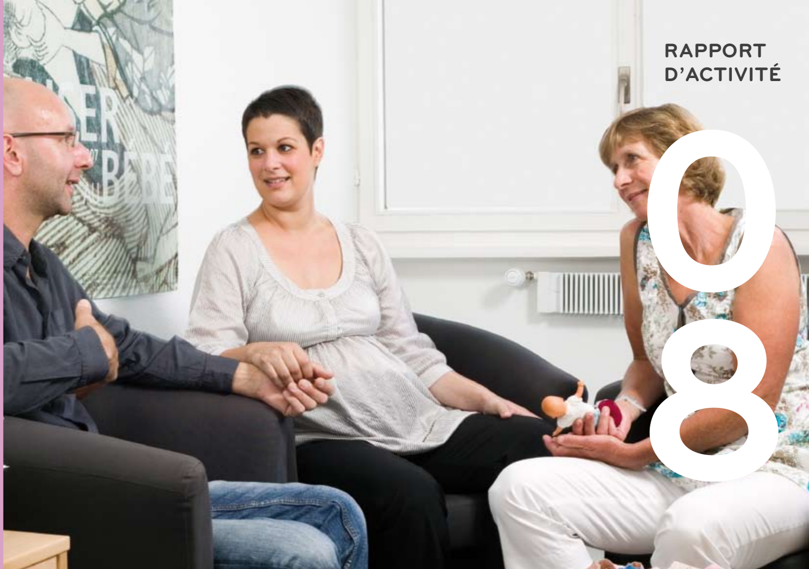
conception graphique: www.oxpde.ch