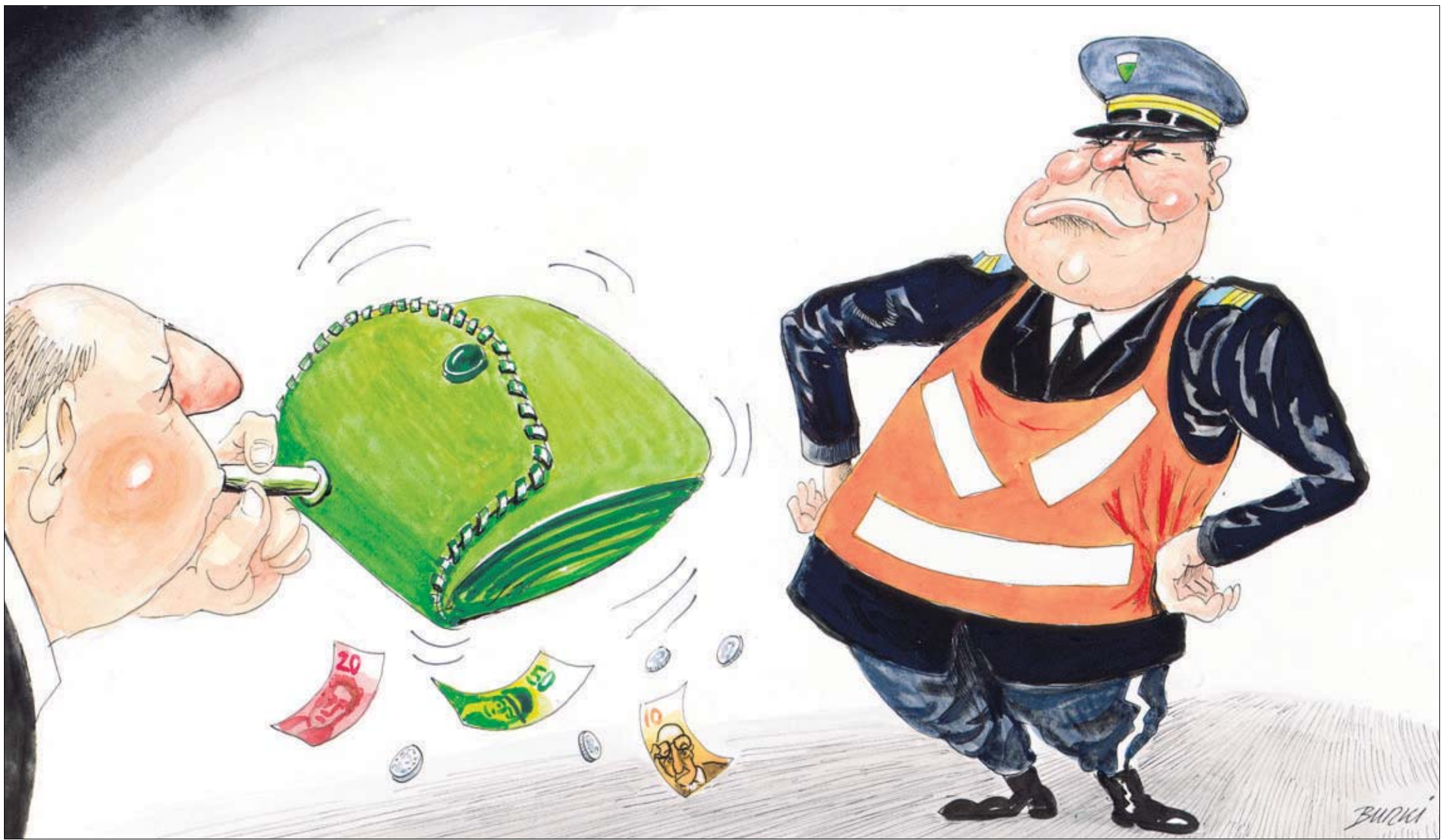
SIGNÉ BURKI La police facture ses interventions.