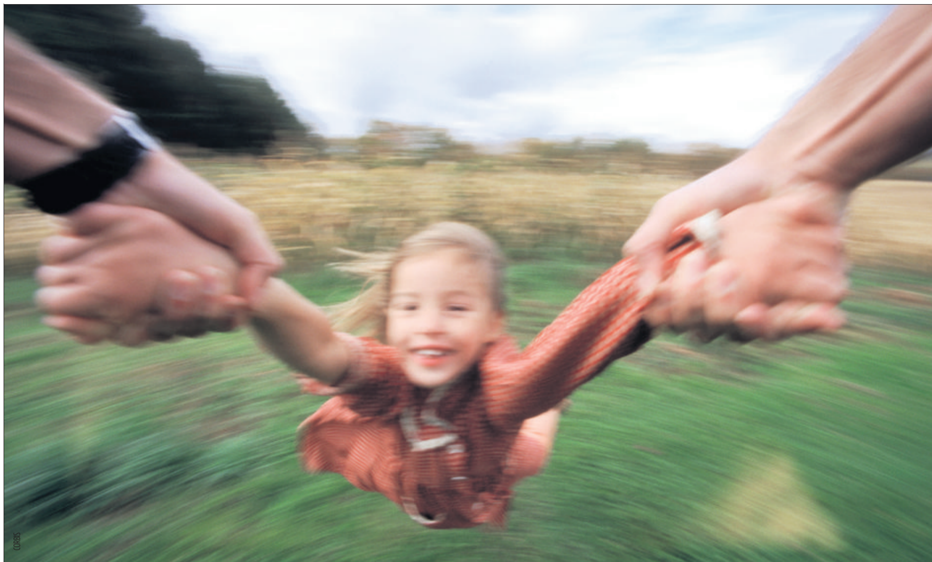
FAMILLE Le Conseil fédéral aimerait établir une forme d'équité entre les deux parents, au nom du bien de l'enfant qui a besoin de son père et de sa mère. Une démarche qui est loin de faire l'unanimité en Suisse.